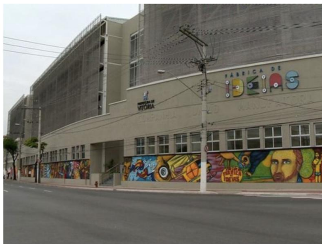
Fábrica de Ideias, em Jucutuquara, está cedida pela Prefeitura de Vitória ao Ifes desde 2016.

A Prefeitura de Vitória solicitou ao Instituto Federal do Espírito Santo (Ifes) o distrato da cessão do prédio da Fábrica de Ideias, localizado em Jucutuquara. O acordo para que o espaço fosse utilizado pela instituição de ensino foi firmado em 2016 e previa o uso em gestão partilhada com o município.